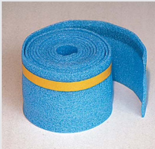
Knauf Périmousse Adhésif (mise en œuvre plus facile)