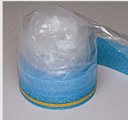
Knauf Périmousse Duo (avec adhésif et rabat polyéthylène)